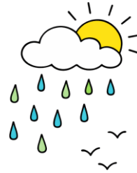
PLOAIE DE PRIMĂVARĂ