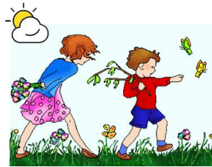
TIMP FRUMOS DE JOACĂ