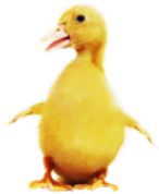
BOBOC DE RAȚĂ